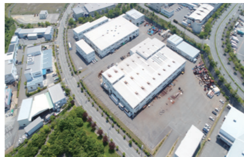
神戸工場 神戸電鉄 木津駅から徒歩10分 約800m

滋賀工場 〒520-3035 滋賀県栗東市霊仙寺3丁目14番63号 TEL.077(553)5121 FAX.077(553)5124